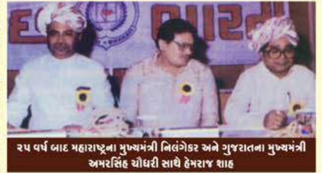
૨૫ વર્ષ બાદ મહારાષ્ટ્રના મુખ્યમંત્રી નિલંગેકર અને ગુજરાતના મુખ્યમંત્રી અમરસિંહ ચૌધરી સાથે હેમરાજ શાહ

બૃહદ મુંબઈ ગુજરાતી સમાજની સ્થાપના ૧૯૮૫ માં ૩૧મી ડિસેમ્બરે કરી, ત્યારે પણ બન્ને મુખ્યમંત્રીઓ ૧૧.૧૧.૨૧ નિલંગેકર પાટીલ અને અમરસિંહ ચૌધરી અને કેન્દ્ર સરકારમાંથી યોગેન્દ્ર મકવાણાએ હાજરી આપી હતી.